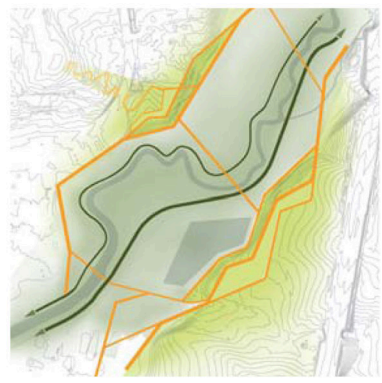
Erschließung Wege entlang des Roten Main: Ein übergeordneter Geh- und Radweg ermöglicht die 'achtnah' übergeordnete Verbindung in Richtung Eremitage und Innenstadt. Der 'austauschender' Weg folgt dem direkten Gewässerlauf des renaturierten Roten Mains. Panoramawege: Die Panoramawege gliedern die Landschaftsterrassen in Szene. Von hier eröffnen sich Ausblicke ins Tal und in die umgebende Landschaft. Verbindungen über den Roten Main: Drei Wegsachsen mit Brücken verbinden die Parkterrassen über den Fluss hinweg.