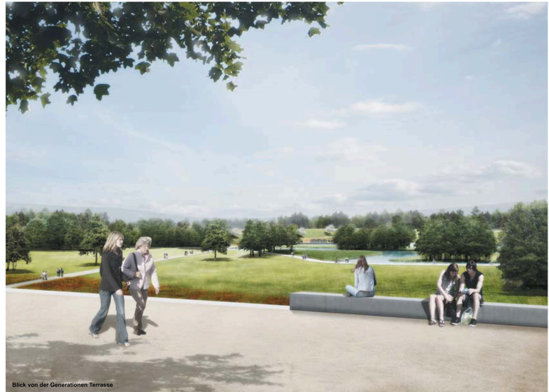
Blick von der Generationen Terrasse