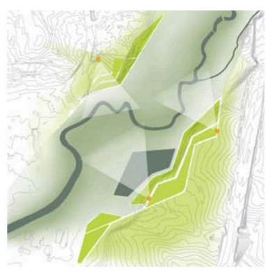
Landschaftsterrassen Das Bearbeitungsgebiet ist durch ein deutliches von West nach Ost verlaufendes Talrelief geprägt. Dieser natürliche Geländevorsprung wird durch die Anlage großzügiger Landschaftsterrassen in Szene gesetzt. Die Terrassen bilden zugleich attraktive Aussichtspunkte.